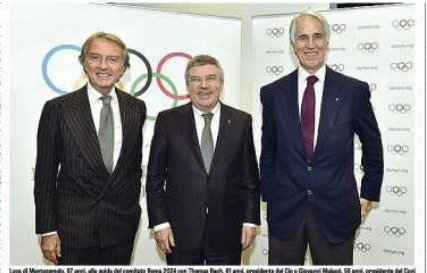
Luca di Montezemolo, 67 anni, alla guida del comitato Roma 2024 con Thomas Bach, 65 anni, presidente del Cio