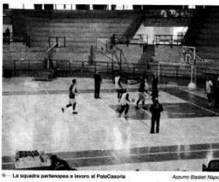
La squadra partecipa a lezioni di Palestra