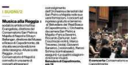
Il concerto di via San Carlo alla stazione marittima