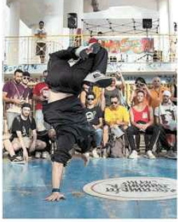
Gruppo di persone all'evento