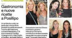
Gruppo di donne all'evento