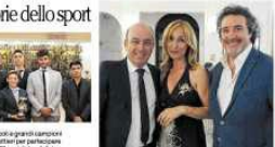
Gruppo di persone all'evento