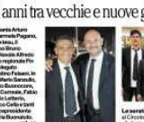
Gruppo di persone all'evento