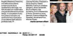
Gruppo di persone all'evento