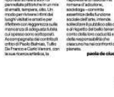
Gruppo di persone all'evento