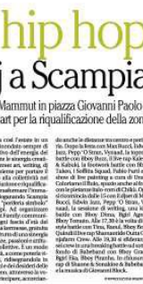
Il festival hip hop a Scampia