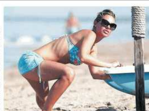
Yoga sul mare.

Il nuovo look di Blasi e Canalis Il nuovo look di Blasi e Canalis