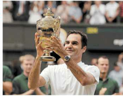
Tennis In finale batte il croato in tre set e vince per l'ottava volta a Londra