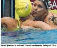
Sarah Sjöström in azione. 23 anni, con Federica Pellegrini, 29...