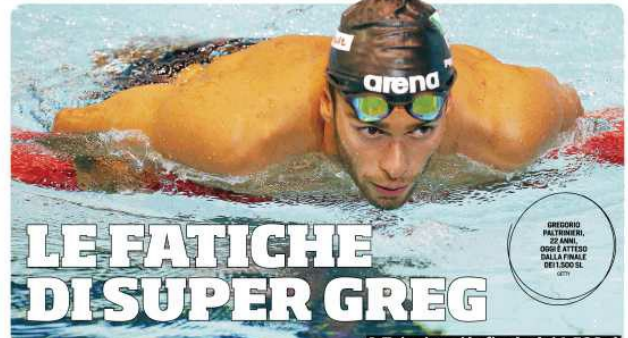
LE FATICHE DI SUPER GREG A Taipei oggi la finale dei 1.500 sl. Giovedì avrà gli 800 e domenica disputerà la 10 km in mare aperto

NUOTO Affascinato dalle sfide, il campione olimpico e iridato non teme certo gli straordinari