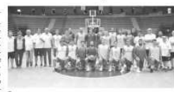
La prima foto ufficiale del Cuore Napoli 2017/2018