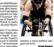
Strutture e mezzi pubblici adeguati per loro.

Il prodotto era in cattivo stato di conservazione, risultando pertanto inutilizzabile, e non idoneo al consumo. Il blitz si è concluso con il sequestro di tutti la merce rinvenuta, nonché l'individuazione di un'attività che si svolgeva in un'area pubblica, oltre che del locale e delle attrezzature utilizzate; mentre il responsabile dell'attività è stato denunciato in stato di libertà alla competente Autorità Giudiziarie. I frutti di mare, sequestrati e provveduti a un'ispezione di laboratorio mediante affollamento in acque profonde del Golfo, analizzati da un'unità navale del Corpo.