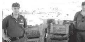
La Finanza con un blitz sequestra 300 chili di mitili

I 300 chilogrammi di prodotto ittico sequestrato, tra vongole e noci bianche, mitili e cozze, non erano destinati al consumo, ma erano stati destinati al confezionamento del prodotto ittico, da destinare al mercato nero, così per fortuna è stato sequestrato. L'attività, svolta con l'aiuto del personale tecnico e sanitario della Asl Napoli 1 Centro, ha consentito di accertare che l'impiego sotto accusa era privo di qualsiasi autorizzazione; le condizioni sanitarie ed igieniche erano decisamente precarie e, infine,