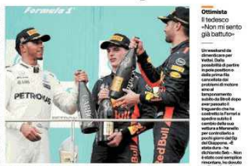
Sul podio Hamilton, Verstappen e Ricciardo. In basso un'immagine di Lewis Hamilton.

Ma il titolo lo riprende Verstappen, l'ottimo nelle qualifiche, non parte. Lewis si accontenta del secondo posto. Tigre Verstappen, Vettel rimonta e spera ancora.