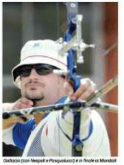
Galazzo con Manzoni e Pizzoccheri in finale ai Mondiali

CICLISMO / EUROPEI PISTA QUARTETTI VOLANTI Volano i quattro italiani agli Europei di pista. In finale, il quartetto italiano si è classificato quarto.