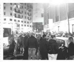
LA FACCELLA DEL CARDARELLI SI ILLUMINA IN VERDE

NAPOLI. Dopo un'azione di mediazione messa in atto dagli agenti della polizia, i disoccupati che nel pomeriggio di ieri, per protesta, hanno forzato l'ingresso del palazzo della ex Provincia di Napoli, hanno lasciato la sede di piazza Matteotti. È rimasto solo il presidio davanti alla Provincia in attesa di un incontro sulla problematica relativa alla loro protesta. La protesta dei disoccupati appartiene al coordinamento precario "Bros", dal nome di un progetto regolato di formazione e impiego, secondo quanto accertato dalla Polizia di Stato, è scaturito da un bando che riguarda l'edilizia. Bando che poi il sistema elettronico ha segnalato e il presidio all'interno della sede è stato rimosso. Siamo comunque presi dai provvedimenti, per occupazione di edificio, per chi ha forzato l'ingresso danneggiando il portone. I disoccupati che hanno forzato il portone, infatti, sono già stati identificati e segnalati. Per loro verranno adottati i provvedimenti giuridici del caso. Il gruppo di disoccupati, circa una quarantina, era entrato nella sede dell'ex Provincia di Napoli, occupando alcuni locali. Altri assenti di loro erano rimasti all'esterno scandando slogan e dando manforte a chi stava all'interno.