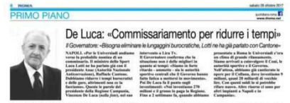
LE OPERE DA RISTRUTTURARE A Napoli tante strutture da riqualificare e ventuno mesi per intervenire

Si candidò per la presidenza del Coni nel 2013, ma fu sconfitto dall'attuale presidente Giovanni Malagò. Da aprile 2014 è membro del consiglio di amministrazione della Fondazione universitaria Foro Italico e nel novembre 2013 è stato confermato segretario generale dei Coe, comitati olimpici europei, carica che ricopre dal 2006. Sul suo nome potrebbe esserci convergenza tra il ministro dello Sport Luca Lotti (a cui spetta l'indicazione), il numero uno del Coni Giovanni Malagò, il presidente della Regione Vincenzo De Luca e il sindaco Luigi di Magistris.