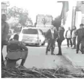
Il centro di accoglienza di Cirigliano d'Aviano

Caserta che come Comune non possiamo più accettare altri arrivi di migranti. Il primo cittadino aggiunge: «Tra migranti fanno parte della rete. Spese, e altri che arrivano per chiedere l'asilo politico, a Cirigliano gli immigrati sono quasi 200, che si aggiungono a quelli già presenti da anni, come i ruggini. Sul territorio non ci sono mai stati problemi tra cittadinanza italiana e stranieri, ma da qualche tempo mi arrivano lamentele da parte di famiglie che vivono nelle vicinanze delle comunità di accoglienza dei migranti che spesso protestano per le condizioni di accoglienza non dignitose, anche se sono ospitati in buone strutture. La scorsa settimana uno di loro ha dato in escandescenza ed è dovuta intervenire un'ambulanza per un trattamento sanitario obbligatorio. Il tutto mentre il senatore Luigi Mancini è sotto: «È necessario e urgente sottoporre a una verifica rigorosa le condizioni dei centri di accoglienza straordinaria dove si trovano decine di migliaia di richiedenti asilo che sembrano sottoposti solo al controllo della legge italiana».