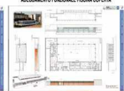
L' intero complesso strutturale che ospita la piscina coperta sarà oggetto di interventi che potranno contribuire a renderla più accogliente per quanto verranno usufruite dei servizi per tutte le attività natatorie

MARTEDÌ E MERCOLEDÌ PROSSIMI CON VANDERPLAS