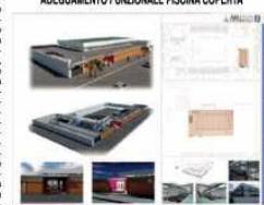
Ecco il progetto di recupero, riqualificazione e valorizzazione della piscina coperta che prevede sia interventi sulla stessa vasca, che sarà completamente rifatta, che sulle infrastrutture che faranno da contorno alla struttura