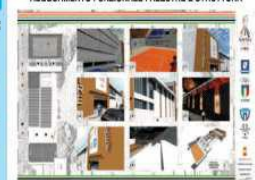
L' intervento complessivo riguarderà anche il campo di basket (riquadro 2), le palestre (riquadri 3 e 4), il campo di hockey (1) in modo da avere un quadro complessivo che porterà ad una completa riqualificazione della struttura (riquadro 8)

ADEGUAMENTO FUNZIONALE PALESTRE E STRUTTURE