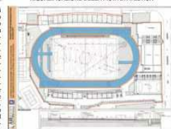
Tra i lavori previsti l' adeguamento funzionale della pista di atletica (in colore scuro nell' immagine), che sarà interamente rifatta recuperando in pieno la sua destinazione d' uso e la piena operatività per gli atleti che ne usufruiranno

RIQUALIFICAZIONE DELLA PISTA DI ATLETICA