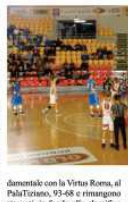
LA CRONACA. Privi dell'ala Nikolic e con il play Thomas, non al meglio per un problema muscolare, gli azzurri (49) da 2 a 25% da 3) hanno fatto clamorosamente il match più impressionante della stagione, difensivamente e anche mentalmente, non dando mai l'impressione di poter invertire i destini nefasti della contesa. In questa, ha avuto stonata solo nei primissimi minuti di gioco.

per poi trasformarsi in un monologo del team di casa (Nene Thomas e Roberts con 52 punti messi a segno in due), a sua volta privo del pivot Vedovato e dell'ala Benetti e con l'altro lungo Filley non il meglio fisicamente e reduce da un periodo di stop. Nella cattiva serata del team partenopeo, in doppia cifra la guardia Turner, con 16 punti, ma solo 1/6 da 2 punti e 4 palle perse e l'altro estremo, Mascio, con 21 punti e 7/12 al tiro: da rimarcare anche i 17 punti di un volenteroso Rosconi e i 7 rimbalzi di Camso. Napoli, ha preso il confronto anche con la piovra con Roma (38 canariblu catturati dai capitano contro le 23 del partenopeo), in una serata decisamente triste e infelice. Domenica prossima, gli azzurri affrontarono Triviole in la marea amiche, ma brucia davvero la sconfitta con Roma, che praticamente può dire al campionato del Cuore Napoli. Una stagione davvero da dimenticare e con tanti errori com-