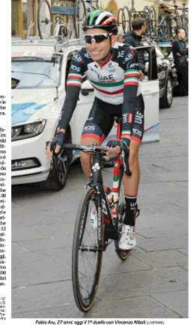
Fabio Aru, 27 anni, oggi il 1° di quello con Vincenzo Nibali