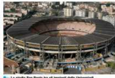
La stadio San Paolo tra gli impianti delle Universiadi