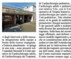
di Cardiologia pediatrica e di pediatria con relative Uilc, con le Unità operative di Trapianti Integrate di cardiologia pediatrica per adulti e per i figli pediatrici». Tale struttura è in grado di soddisfare pienamente i bisogni assistenziali dei pazienti adulti e pediatrici nelle diverse fasi assistenziali del trapianto. Sulla base dei monitoraggi effettuati, sarà definito un nuovo modello organizzativo, anche in considerazione delle proposte delle riunioni impegnate.

NAPOLI. Una riunione finalizzata alla definizione di un modello organizzativo integrato che metta insieme le migliori professionalità dell' Unità operativa di Cardiologia pediatrica e di Cardiologia pediatrica e di Cardiologia pediatrica è stata convocata oggi presso l' Azienda ospedaliera dei Colli di Napoli, «in merito alla problematica dei trapianti cardiaci e dell' assistenza ai trapiantati in età pediatrica. Ad annunciare la Direzione Salute della Regione Campania e il Centro regionale trapianti, «a supervisione dei pediatri, con i quali, è noto, è stata decisa un anno fa dal Ministero della Salute la spartizione dell' accertamento degli organi