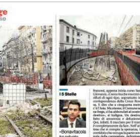
Le immagini di via Marina tra degrado e lavori realizzati negli ultimi mesi