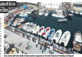
Una vista dall'alto delle imbarcazioni esposte al Circolo Nautico Posillipo di Napoli