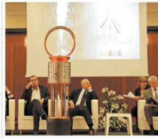
I grandi universitari De Gennaro e De Luca con i loro colleghi, entrati in vertice con i piloti e i manager di governo

Aggiornata il piano di lavoro per la trentesima edizione dell' esposizione nautica Navigare, che si svolgerà dal 14 aprile al 22 aprile al circolo Posillipo di Napoli. L' atto costitutivo è stato sottoscritto dai presidenti delle associazioni nautiche di Lazio, Campania e Sicilia in rappresentanza di oltre 250 aziende. Il napoletano Gennaro Amato, già presidente dell' ANRC, è stato nominato Presidente del Polo Nautico Italiano.