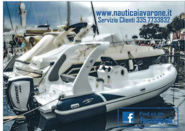
www.nauticaiavarone.it Servizio Clienti 335.7733832