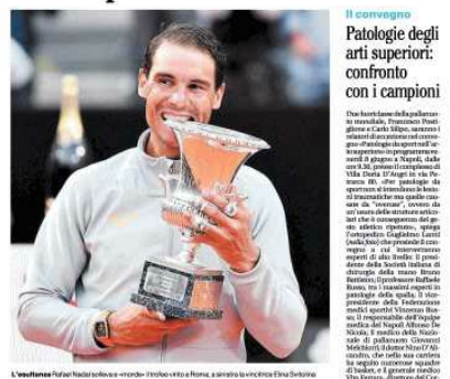
Il trionfo di Rafael Nadal a Roma. Nella foto: il vincitore con il trofeo