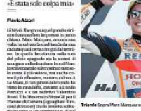
Marc Márquez celebra la vittoria al Gran Premio di Francia.

Lo spagnolo della Honda approfitta delle cadute dei rivali: terzo successo consecutivo Marquez fa il vuoto, resistono Petrucci e Rossi