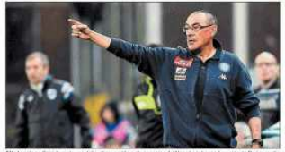
Maurizio Sarri, allenatore del Napoli

Sarri felice agitato. Il 1° luglio, ora, il club non sa ancora se vuole cedere il tecnico. Il club non sa ancora se vuole cedere il tecnico. Il club non sa ancora se vuole cedere il tecnico.