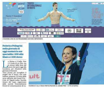
FEDERICA A ALLA TERZA PARTECIPAZIONE AL GRAND PRIX - CITTÀ DI NAPOLI

Federica Pellegrini nella giornata di oggi motterà le sue specialità: i 100 stile libero e i 100 dorso. L'atleta di 26 anni, che ha vinto il titolo europeo di 100 stile libero a Glasgow, è tra i più forti del mondo. Pellegrini ha già fatto vedere in passato tempi davvero importanti in vasca corta: chissà che proprio durante la kermesse non possa arrivare qualche sorpresa in questo senso. Gli ingredienti per una grande giornata di sport ci sono davvero tutti.