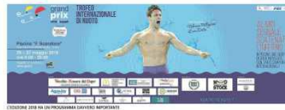
LEADER 2018 IN UN PROGRAMMA DAVVERO IMPREVEDIBILE

Federica Pellegrini nella giornata di oggi nuoterà le sue specialità: i 100 stile libero e i 100 dorso. È la prima volta che la regina del nuoto italiano si presenta al Grand Prix Città di Napoli. Pellegrini è la campionessa del mondo nei 100 stile libero e nei 100 dorso. Ha vinto anche la medaglia d'oro ai Mondiali nel 2017 nei 100 stile libero. Ha vinto anche la medaglia d'oro ai Mondiali nel 2017 nei 100 stile libero. Ha vinto anche la medaglia d'oro ai Mondiali nel 2017 nei 100 stile libero.