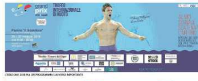
FEDERICA ALLA TERZA PARTECIPAZIONE AL GRAND PRIX - CITTÀ DI NAPOLI

Federica Pellegrini nella giornata di oggi toccherà le sue specialità: 100 stile libero e 100 dorso È il ritorno di Federica Pellegrini alla Scandone per chiudere nella giornata di oggi la sua partecipazione al Grand Prix - Città di Napoli-trofeo Vecchio Amaro del Capo. La campionessa torinese si è iscritta alle gare di 100 metri stile libero e 100 metri dorso. Pellegrini torinese si è iscritta alle gare di 100 metri stile libero e 100 metri dorso. Pellegrini torinese si è iscritta alle gare di 100 metri stile libero e 100 metri dorso.