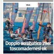
Doppio acrobatico 29er toscomademesi ok