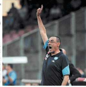
La Chelsea è pronta a offrire un contratto da 10 milioni di euro annui, con un bonus di 10 milioni in caso di vittoria in Europa.

La Chelsea è pronta a offrire un contratto da 10 milioni di euro annui, con un bonus di 10 milioni in caso di vittoria in Europa. Sarri è pronto a lasciare il Napoli per il Chelsea, ma solo se il contratto sarà di almeno 10 milioni di euro annui, con un bonus di 10 milioni in caso di vittoria in Europa.