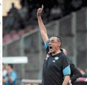
La stella Sarri lascia il Napoli dopo tre anni in attesa della offerta in che rapporto con il Chelsea di Abramovic

Il Chelsea di Abramovic è pronto a pagare 10 milioni di sterline per il ritorno di Sarri in Europa. L'accordo è a un passo. Il Chelsea di Abramovic è pronto a pagare 10 milioni di sterline per il ritorno di Sarri in Europa. L'accordo è a un passo. Il Chelsea di Abramovic è pronto a pagare 10 milioni di sterline per il ritorno di Sarri in Europa. L'accordo è a un passo.