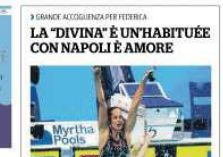
LA "DIVINA" È UNHABITUÉE CON NAPOLI È AMORE

Luca Dotto è il campione europeo nel 100 stile libero. Ha vinto la medaglia d'oro ai campionati europei nel 2017. Ha vinto la medaglia d'oro ai campionati europei nel 2017. Ha vinto la medaglia d'oro ai campionati europei nel 2017. Ha vinto la medaglia d'oro ai campionati europei nel 2017.