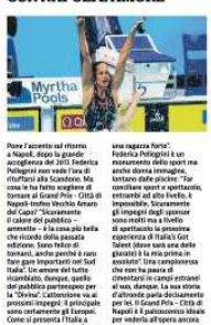
UNA SAGGIATA TURCA A NAPOLI: DOPO LA GRANDE VITTORIA DI FEDERICA PELLEGRINI IL NUOTO ITALIANO HA UNO DEI SUOI PIÙ FORTI TALENTI

Una ragazza turca a Napoli: dopo la grande vittoria di Federica Pellegrini il nuoto italiano ha uno dei suoi più forti talenti. La ragazza di 26 anni, che ha vinto il titolo europeo di 100 stile libero a Glasgow, è tra i più forti del mondo. Pellegrini ha già fatto vedere in passato tempi davvero importanti in vasca corta: chissà che proprio durante la kermesse non possa arrivare qualche sorpresa in questo senso. Gli ingredienti per una grande giornata di sport ci sono davvero tutti.