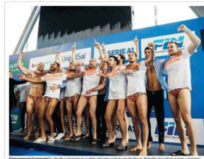
3 intercontinentali? L'equilibrio? La Pro Recco (in alto) si scontra con il Pro Recco. Probabile che la finale di Coppa...

GIORNALE DI BRESCIA - Sabato 26 maggio 2018