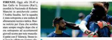
Lorenzo Insigne, Mario Balotelli e Gianluigi Donnarumma

ROMA. Oggi, alle 20.45 a San Gallo in Svizzera (Rai), esordirà la Nazionale di Roberto Mancini in amichevole contro l'Arabia Saudita. Infieldi la squadra è stata sottoposta a una seduta di allenamento tecnico-tattica. Dopo un'ora di allenamento, il tecnico ha parlato con i giocatori per motivarli e per far capire che si era sottoposti ad accertamenti giovedì scorso per non essere ammessi al campo con il Valencia. Sposo Insigne ha effettuato l'intero allenamento con i compagni. Questa la probabile formazione: Donnarumma; Zapacosta; Bonucci, Romagnolo, Cricchi; Pelligrino, Jorginho, Veratti, Politano, Balotelli, Insigne.