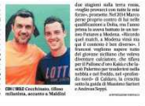
Magnini sotto choc «Indagine vergognosa»