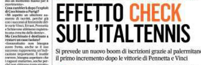
EFFETTO CHECK SULL'ITALIA TENNIS

► Doping, chiesti 8 anni di squalifica per l' ex azzurro NUOTO ROMA È un' evidenza ingiustizia. Arriva una pesante richiesta di squalifica da parte della Procura antidoping Nado Italia (otto anni) e l' ex nuotatore Filippo Magnini va al contrattacco. «Dopo tutta la collaborazione prestata nelle indagini in questi otto mesi di strazio per me, leggo - ha spiega Magnini in un comunicato stampa - il mio nome ancora sbattuto in prima pagina accostato alla parola doping nonostante, ripeto, la Procura della Repubblica di Pesaro abbia già chiuso il caso dichiarandomi totalmente estraneo ai fatti».