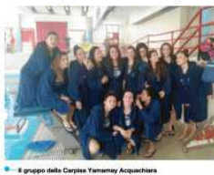
Il gruppo della Carpisa Yamamay Acquachiara

IL COMMENTO. Quella con Savona sarà una sfida media per le ragazze della Damiani, che così ha commentato l' incontro: «Affronteremo una squadra completa in ogni reparto e con ottime individualità. Non potrebbe essere altrimenti, dal momento che si è piazzata al secondo posto nel girone Nord con un solo punto di distacco dalla capolista Co-