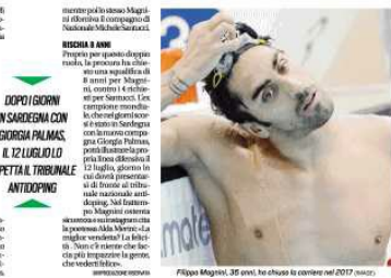
Filippo Magnini, 38 anni, ha chiuso la carriera nel 2017 (a destra)