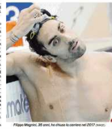
Filippo Magnini, 35 anni, ha chiuso la carriera nel 2017 (a destra)