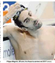
Filippo Magnini, 36 anni, ha chiuso la carriera nel 2017