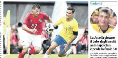
La Juve fa giocare il baby degli insulti anti-napolitani

Il prossimo acquisto degli azzurri ha già segnato contro il Borussia Dortmund. Sarà il vice Hysaj e costerà 12 milioni: è l'acquisto più caro nella storia del calcio austriaco.