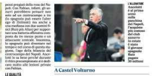
A Castel Volturno

Il secondo dei due Napoli targati Carlo Ancelotti è il portiere di riserva Carlo Ancelotti che ha fatto il debutto in occasione di un'amichevole disputata con il Lazio.