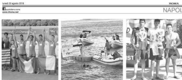
LA PETIZIONE Firme per chiedere al sindaco di rivedere la vendita della struttura sportiva Giovani atleti scendono in campo: «Lasciateci il Circolo Posillipo»

Una sconfitta per tutta la città e non solo per l'amministrazione di Luigi de Magistris.