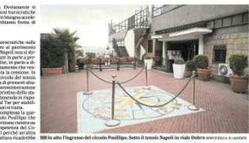
Sotto il cielo il Tennis Club di Posillipo. Sotto il Tennis Club in viale Doherty sono in corso i lavori