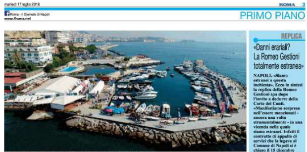
La prestigiosa sede del Circolo Posillipo: ogni mese paga meno di 2mila euro di locazione