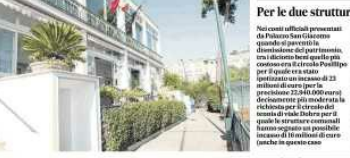
Sotto il cielo il Tennis Club di Posillipo. Sotto il Tennis Club in viale Doherty sono in corso i lavori