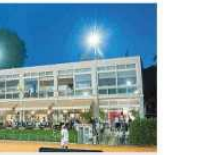
Seimila euro al mese il canone versato dal Circolo Posillipo, secondo alcune stime di mercato