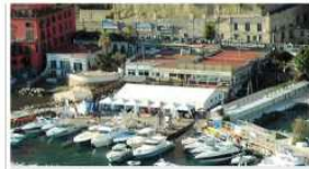
Seimila euro al mese il canone versato dal Circolo Posillipo, secondo alcune stime di mercato