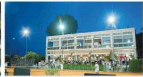
Diecimila euro al mese il canone versato dal Circolo Tennis Mergellina, secondo alcune stime di mercato