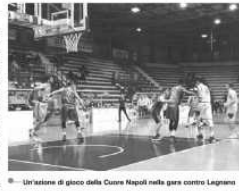
Librazione di gioco della Cuore Napoli nella gara contro Legnano

NAPOLI. Il Cuore Napoli Basket, a breve, conoscerà il suo nuovo presidente. Il nuovo direttore è il capitano al quale parteciperà dopo la retrocessione in B sul parquet. Transera la giornata di lunedì, termine ultimo per la presentazione delle iscrizioni nei vari tornei nazionali, compresa la A2, sembra che tutti i club avuti dietro abbiano presentato le varie documentazioni necessarie: ora, si attendono le successive relazioni sui controlli contabili sulle varie società affiliate dalla Conice (la Federazione Italiana Pallacanestro). Venerdì 13, poi, ci sarà l'ultimo atto burocratico, con la definitiva composizione dei comitati sul tema del Consiglio Federale Fip di Roma. L'impressione al momento è che, a meno di un mese, il club partenopeo parteciperà al prossimo campionato di serie B, dove incontrerà altre compagini campionesse, come la recitata Sporting Club Juve Caserta, l'Arcobaleno, il Battaglia e la neopromossa Virtus Pozzuoli. Sul fronte societario, infine, si