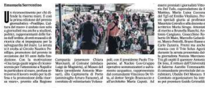
Il premio Posillipo, omaggio al mare. In alto: il premio Posillipo, omaggio al mare. In basso: il premio Posillipo, omaggio al mare.