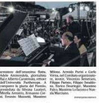
Il premio Posillipo, omaggio al mare. In alto: il premio Posillipo, omaggio al mare. In basso: il premio Posillipo, omaggio al mare.