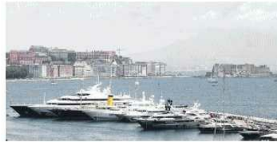
Al Molo Luise attraccano le imbarcazioni faraoniche di «Paperoni» nel mondo: dal «Symphony» del re del lusso Arnault al «Moonlight II» del sultano Bin Khalifa