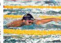
Gabriele Detti, 24 anni, con un record 800, 71 secondi ai Giochi di Rio, 1000 metri.

Un anno di guai alla spalla, domani torna sui 400: «Vorrei nuotare senza dolore» Mattia Poli Prove generali di Detti al meeting di Carpi, a casa dell' amico Greg Paltrinieri, Gabriele domani ricomincia con le gare dopo il suo anno nero. Sì, c' erano stati gli Assoluti ad aprile, ma proprio a Riccione il campione del mondo degli 800 sl e bronzo olimpico di 400 sl e 1500 si rese conto che la spalla sinistra non era guarita, non abbastanza almeno per poter puntare agli Europei di Glasgow. «Sto benino, non potrebbe essere altrimenti in questo momento della stagione - sdrammatizza Detti -, ogni tanto c' è ancora un po' di fastidio. Il primo scalino da salire sarà il fatto di gareggiare senza sentire dolore». Sensazione che gli manca dall' autunno di un anno fa, quando una mattina si svegliò con la spalla malandata. «Ci sono già passato, sapevo come affrontare tutto. Questo infortunio mi ha fatto inserire negli esercizi con gli elastici prima delle gare» spiega Detti, che sarà al via nei 400 anche al Nico Sapio di Genova e poi a Livorno: «Altri obiettivi non me li pongo, prima voglio vedere come va».