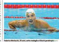
Federico Morlacchi, 25 anni, nella medaglia d'oro ai Giochi paralimpici

Riproduzione autorizzata licenza Ars Promopress 2013-2018