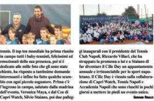
Il campione mondiale croato Marin Cilic, ospite d'onore di una giornata di sport ideata e promossa da Capri Watch.

NAPOLI. Ieri pomeriggio speciale per oltre mille ragazzi delle scuole tennis campane che, in Villa, hanno potuto incontrare da vicino il campione mondiale croato Marin Cilic, ospite d'onore di una giornata di sport ideata e promossa da Capri Watch. Marin Cilic è stato il secondo croato nella storia del tennis ad essersi aggiudicato un torneo del Grande Slam: quest'anno è stato il numero 3 del mondo, finalista a Wimbledon nel 2017 e agli Australian Open 2018 (perdendo in entrambe le occasioni contro Federer), e vincitore degli Us Open nel 2014. La speciale evento è stato nei campi rossi del Tennis Club Napoli, dove il 30enne croato greco d'insolito dai tanti fan presenti in Villa si è esibito con un set nel mondo del più piccolo, immergendosi nella realtà dei piccoli atleti delle scuole