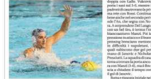
Miglior marcatore. Per quanto riguarda il Posillipo