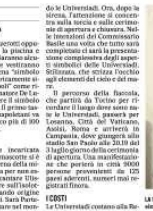
La sirenna Partenope simbolo delle Universiadi

IL SAN PAOLO Entro fine settimana sarà presentato un cronoprogramma che preveda la fine dei lavori per il 29 giugno. La Mondo indicherà anche quali sono i settori dello stadio sui quali si potrà lavorare prima del 20 maggio, vale a dire prima della fine del campionato di calcio, e dopo l' ultima partita del