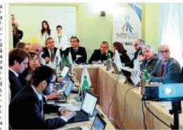
La delegazione di Jovanotti è stata smentita. L'artista sarà a Castel Volturno il 13 luglio per il Jova Beach Party. Jovanotti sarà alla Spiaggia Lido Fiore Flava Beach di Castel Volturno per l'unico data campana del Jova Beach Party, fissata dal 6 dicembre, è quindi smentita categoricamente la possibilità di una partecipazione dell'artista, in qualunque forma, alla cerimonia di apertura dell'Universiade 2019 prevista per il 3 luglio a Napoli.

Attenti Cinquantanove capi delegazione provenienti da tutto il mondo sono attesi a Napoli la settimana prossima per l'Hod Meeting, il vertice dei Paesi iscritti all'Universiade di Napoli: saranno 59 sui 120 iscritti ai Giochi. L'arrivo è previsto nella giornata di lunedì in vista della cerimonia di martedì mattina, alla Stazione Marittima, quando il progetto Napoli 2019 verrà illustrato dal presidente della Regione Vincenzo De Luca, dal commissario straordinario Gianluca Basile, dal presidente del Cusi Lorenzo Lentini e quello della Fisù Oleg Matytsin.