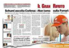
12 agosto 2009

10 ANNI. Michael Schumacher ha guidato per l'ultima volta una Ferrari da Gp l'11 agosto del