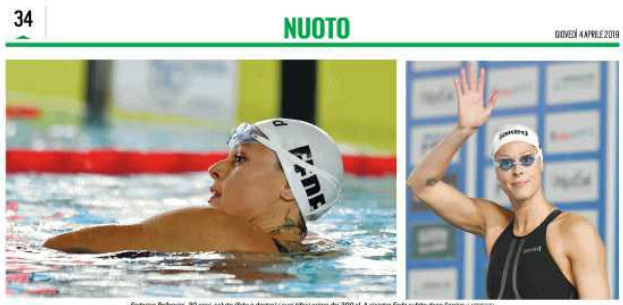
Federica Pellegrini, 30 anni, subito (foto a destra) / a sua volta prima del 200 sl al Assoluti Unipol Sai 2019 (a sinistra)

Con il passare delle gare e della preparazione andrà sempre meglio. Sono contenta anche per la