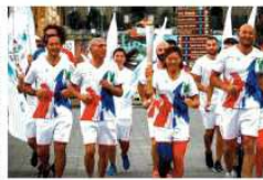
Il segretario della Fisv Saintrond dirigerà le operazioni alla Stazione marittima. Gesac, firmato l' accordo

NAPOLI. Le prime impressioni su impianti e accoglienza si sono svolte davanti a del buon cibo in un contesto suggestivo come quello del Chiostro di Santa Chiara. Arrivati in città per partecipare all' Hod, i capi delegazione dei Paesi iscritti all' Universiade, che si terrà dal 3 al 14 luglio, si sono riuniti per fare il punto della situazione. «È andata bene - commenta il commissario delle Universiadi Gianluca Basile, a margine del convegno promosso dall'Università Parthenope sul ruolo della ricerca scientifica nel campo delle attività sportive - Sono rimasti incantati dal posto e le prime impressioni sugli impianti sono positive. Qualcuno mi ha confessato di temere il disastro e invece è rimasto favorevolmente colpito».