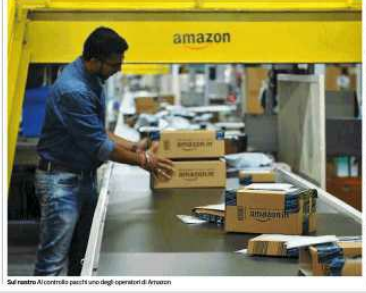
Sul banco d'arrivo pacchi uno degli operatori di Arzano

Il contratto prevede l' affidamento a Gesac dei servizi logistici, di accreditamento, accoglienza e smistamento delle delegazioni di atleti, accompagnatori e ospiti.