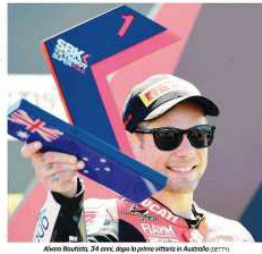
Álvaro Bautista, 34 anni, dopo la prima vittoria in Australia (2011)

MIRCO MELONI Quando incontrai lui, nel suo dimore di Albi, Emanuele Mortola mi parlò di un pilota che aveva appena vinto la Supercopa di Europa. Bautista non si ferma più. È un pilota che ha vinto il campionato di Supercopa di Europa nel 2018. Bautista non si ferma più. È un pilota che ha vinto il campionato di Supercopa di Europa nel 2018. Bautista non si ferma più. È un pilota che ha vinto il campionato di Supercopa di Europa nel 2018.