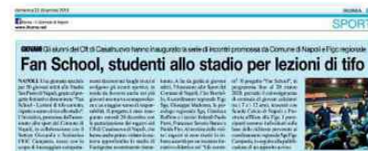
Fan School, studenti allo stadio per lezioni di tifo