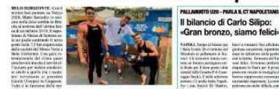
Sanzullo brilla in Brasile: è podio